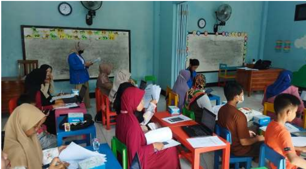
Gambar 3. Pelatihan MS Word 2016

Gambar 3 Pelatihan dimulai setelah Office 2016 telah siap digunakan. Para peserta terlihat antusias dan semangat mengikuti pelatihan ini.