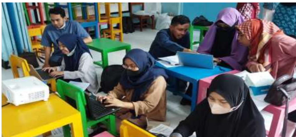
Gambar 2. Persiapan Pengabdian masyarakat

Gambar 2 adalah Persiapan acara pengabdian masyarakat. Pada persiapan peserta diminta untuk menginstall Office 2016. Sebelum pelatihan sudah diinformasikan, Panitia mencoba membantu apabila ada peserta yang belum menginstall Office 2016.